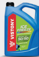
Coolant ICE FREEZE 50/50 PREDILUTED