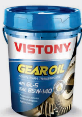
Eje de Transmisión Diferencial GEAR OIL 80W-90 (GL-5)