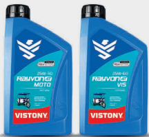
Rayvon 4T Moto MINERAL 25W-50 25W-60