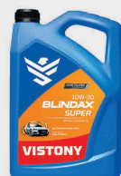
Motobombas BLINDAX SUPER 10W-30