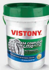
Grasas GRASA COMPLEJO DE LITIO