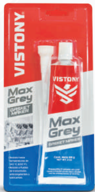
MAX GREY Present: 85 g