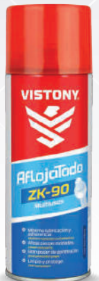
AFLOJATODO ZK-90 Present: 10 Oz.