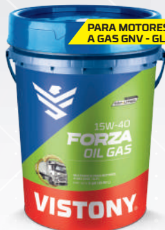
FORZA OIL GAS SAE 15W-40 API CF-4 Present: 1/4 gal - 1 gal - 5 gal - 55 gal