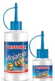
AFLOJATODO Present: 30 ml - 90 ml