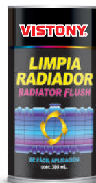
LIMPIA RADIADOR Present: 300 ml.