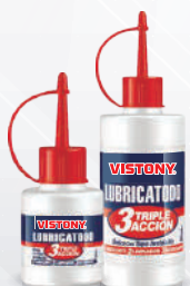
LUBRICADO 3 en 1 Present: 30 ml - 90 ml