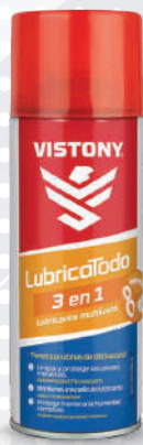
LUBRICADO 3 en 1 Present: 10 Oz.