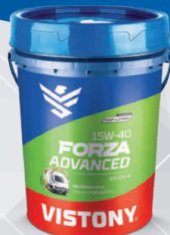
FORZA ADVANCED SAE 15W-40 API CH-4 Present: 5 gal - 55 gal