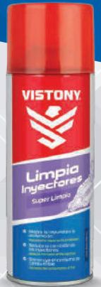
LIMPIA INYECTORES Present: 10 Oz.