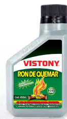
RON DE QUEMAR Present: 200 ml - 1/2 L