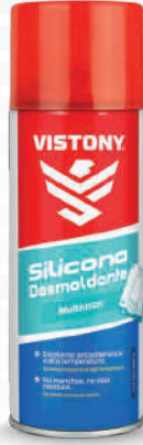
SILICONA DESMOLDANTE Present: 10 Oz.