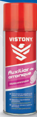
AUXILIAR DE ARRANQUE Present: 10 Oz.