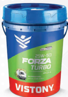
FORZA TURBO SAE 25W-40 API CF-4 Present: 1/4 gal - 1 gal - 2.5 gal - 5 gal - 55 gal