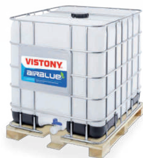
AIRBLUE Present: 18.5 L - 208 L - 1000 L