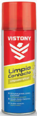
LIMPIA CONTACTO Present: 10 Oz.