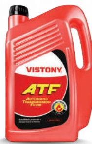
ATF (HIDROLINA) TIPO F Present: 1/8 gal - 1/4 gal - 1 gal - 55 gal