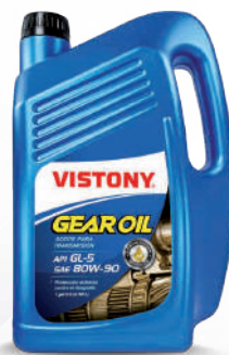
GEAR OIL SAE 80W-90 / 85W-140 API GL-5 Present: 1/4 gal - 1 gal - 5 gal - 55 gal