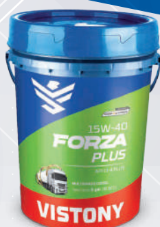
FORZA PLUS SAE 15W-40 API CI-4 PLUS Present: 1/4 gal - 2.5 gal - 1 gal - 5 gal - 55 gal