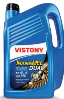
TRANSMEC DUAL SAE 90 / 140 / 250 / 80W-90 API GL-4 Present: 1/4 gal - 1 gal - 5 gal - 55 gal