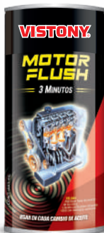
MOTOR FLUSH Present: 10 Oz