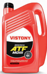
BRIKSON III Present: 1/4 gal - 1 gal - 5 gal - 55 gal