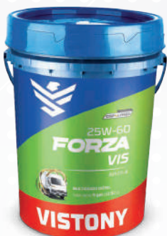
FORZA VIS SAE 25W-60 API CF-4 Present: 1/4 gal - 1 gal - 2.5 gal - 5 gal - 55 gal