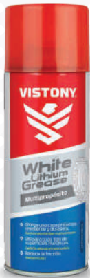
WHITE LITHIUM GREASE Present: 10 Oz.