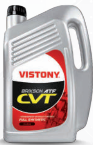
BRIKSON ATF CVT (FULLY SYNTHETIC) Present: 1 L - 5 L