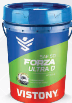
FORZA PLUS SAE 15W-40 API CI-4 PLUS Present: 1/4 gal - 1 gal - 5 gal - 55 gal