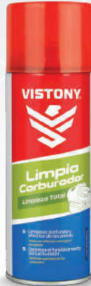
LIMPIA CARBURADOR Present: 10 Oz.