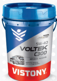
VOLTEK C300 SAE 5W-40 API CK-4 ACEA E9 Present: 1 gal - 5 gal - 55 gal