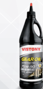
GEAR OIL SYNTHETIC 75W-90 API GL-4 Present: 1 L