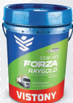
FORZA RAYGOLD SAE 15W-40 API CK-4 Present: 2.5 gal - 5 gal - 55 gal